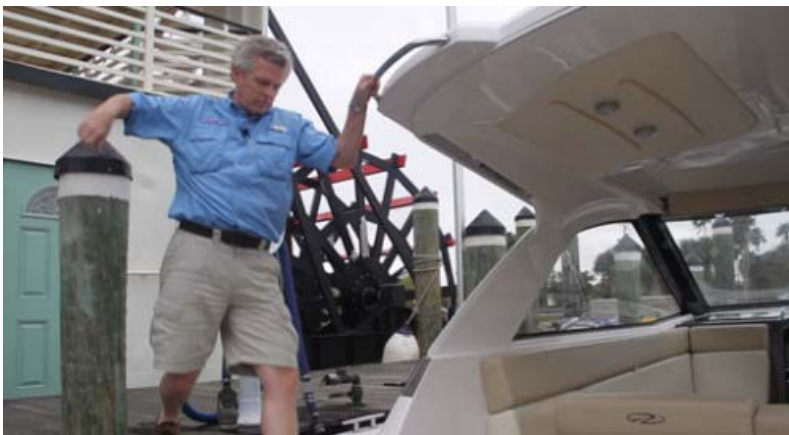
Regal hat die Handläufe für die Sicherheit nicht vergessen. Es gibt noch mehr an den Seiten des Hardtops

Sie können das Boot über die Badplattform betreten, wenn sie am Schwimmsteg anlegen und dann das Cockpit betreten. Natürlich funktioniert das nicht bei einer Kaimauer und für den Fall gibt es Antirutschstufen am Seitendeck, die ein Betreten von der Seite erlauben. Und Regal hat auch keine Handläufe vergessen, die sie bei dem Vorhaben unterstützen. Einmal an Bord, reichlich Platz und Komfort gibt ein Gefühl von Größe, das über die tatsächlich 35 '(10,7 m) Länge des Bootes hinwegtäuscht.